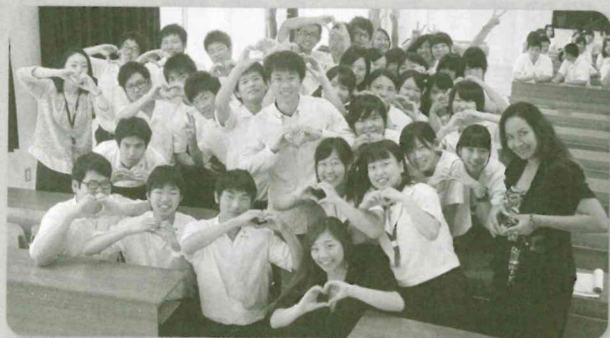
サニーベール市の高校生と嘉穂東高校の生徒たち

交流2年目になる今年は、双方の交流参加校を増やしていき、ますます交流の輪を広げていく予定です。