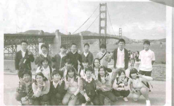
中学生海外研修事業参加の生徒たち (サンフランシスコ)

研修中は世界遺産ヨセミテ国立公園の見学、Tech Museum(テック博物館)やGoogle(グーグル)本社、スタンフォード大学など、シリコンバレーの企業や大学の見学を行いました。そして、サニーベール市では、ホームステイや学校登校などを行い、アメリカの生活や文化に触れ、充実した9日間を過ごしました。