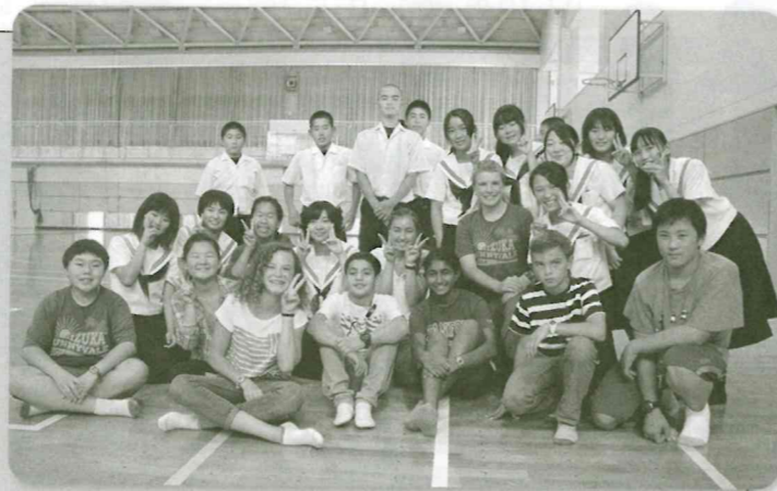
サニーベールミドルスクールと二瀬中学校の生徒たち

まず、伊岐須小学校・二瀬中学校、嘉穂東高校がサニーベール市の中学校や高校と交流を始めました。年賀状やバレンタインカードをやり取りしたり、学校ホームページの英語版を作成してメールを送信したりして交流を深めています。